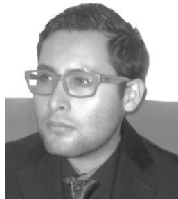
Imagen del autor secundario (100pix X 100pix formato jpg, png, gif)

Licenciado en Psicología por la UNAM FES Zaragoza, participante del comité organizador del 1er Foro de Psicología del Trabajo y las Organizaciones, participante del comité organizador del Primer Foro de Multidisciplina en Ciencias de la Salud, participante como asistente en el 1er Encuentro de Modelos Cognitivos, participante como ponente en el 2º Congreso Nacional y 1er Internacional de Psicología “Avances y desafíos de la Psicología Contemporánea” y participante como ponente en el 1er Foro de Psicología del Trabajo y las Organizaciones. Actualmente investigando sobre los temas de liderazgo y personalidad.