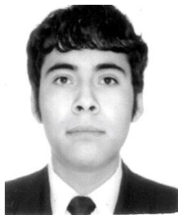
Imagen del autor principal (100pix X 100pix formato jpg, png, gif)

Licenciado en Psicología por la UNAM-FES Zaragoza. Ponente de trabajos de investigación en congresos nacional e internacionales, participante en proyectos de investigación financiados PAPIIME. Organizador de eventos académicos y representante de alumnos en cuerpos colegiados. Participante en brigadas comunitarias en el estado de Oaxaca. Actualmente colaborador en el Departamento de Educación Continua de la FES Zaragoza.