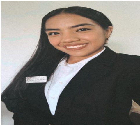
Imagen del autor principal