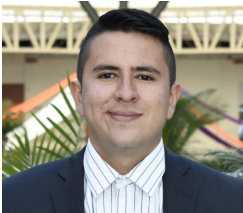
Imagen del autor principal

Ponente y conferencista. Bilingüe en el idioma inglés.