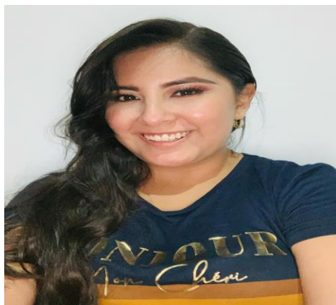
Imagen del autor principal.