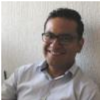
Imagen del autor principal (100pix X 100pix formato jpg, png, gif)

Sus líneas de trabajo se enmarcan en entornos personales de aprendizaje, aprendizaje autorregulado, creencias epistemológicas, herramientas de Internet para el aprendizaje, educación en línea y a distancia, diseño instruccional, redes sociodigitales aplicadas a la educación y Teoría de la Actividad Histórico-Cultural en medios sociodigitales.