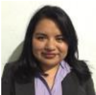
Imagen del autor secundario (100pix X 100pix formato jpg, png, gif)

Licenciada en Psicología egresada de la Facultad de Estudios Superiores Iztacala UNAM del sistema SUAYED. Cursó los campos formativos en Psicología Educativa y Psicología Organizacional. Participó en dos estancias de investigación en la fundación FONABEC centro CODAF Magdalena Contreras con estudiantes de bachillerato a distancia UNAM sobre el tema Habilidades sociales y el segundo tema en Comprensión lectora y búsqueda de información en Internet. Participó con una ponencia en el XXVIII Encuentro Internacional de Educación a Distancia por la Universidad de Guadalajara sobre el tema de redes sociales y su implementación en la educación a distancia para la enseñanza en Psicología.