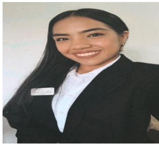
Imagen del autor principal

Ha realizado un Diplomado en Psicología Clínica. Su expectativa profesional es posicionarse como una de las mejores psicólogas clínicas.