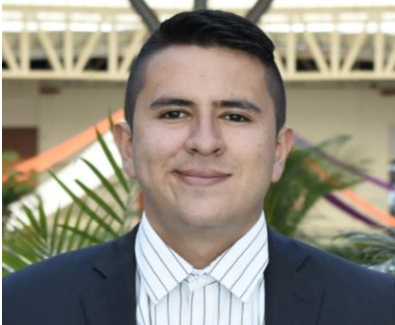
Imagen del autor principal

Ponente y conferencista. Bilingüe en el idioma inglés.