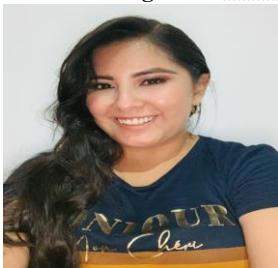
Imagen del autor principal