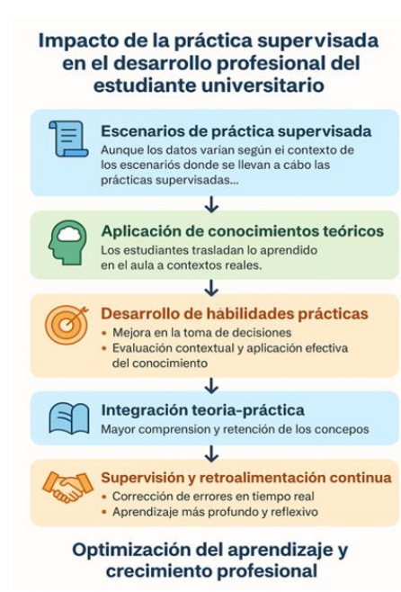
Figura 1. Resultados de la práctica supervisada en el desarrollo profesional del estudiante universitario

Los estudiantes desarrollan habilidades blandas como la comunicación, el trabajo en equipo, la empatía y la gestión del tiempo al interactuar con otros en un entorno de práctica. A medida que los estudiantes enfrentan situaciones reales en un entorno controlado y con supervisión, aprenden a manejar mejor la presión y el estrés asociados con sus futuras responsabilidades profesionales (Ver Figura 1).